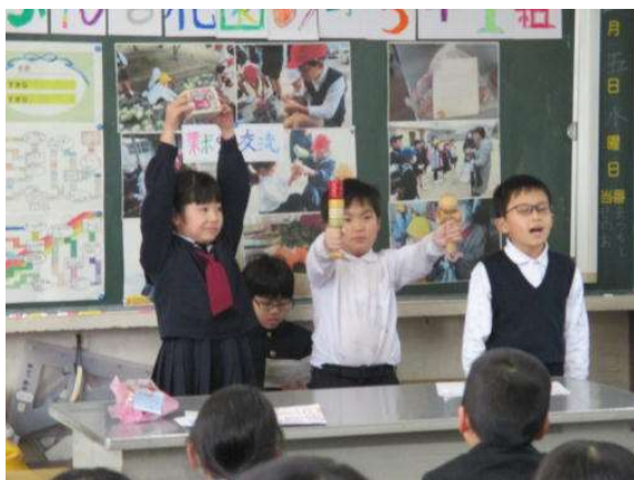
一緒にした昔遊びを紹介したよ