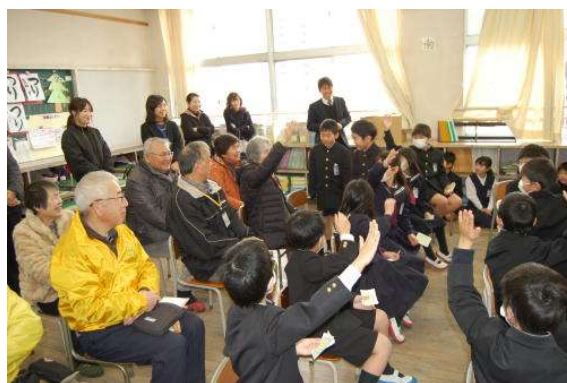
2年生がたくさん発表してくれたよ