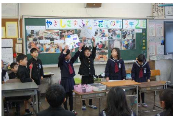
クイズを出したよ