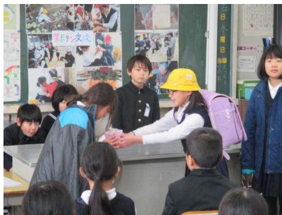
葉ボタンを渡す劇をしました