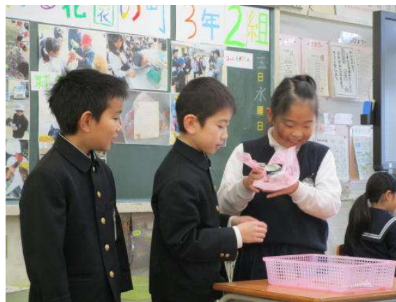
葉ボタンの飾り付けの実演をしたよ