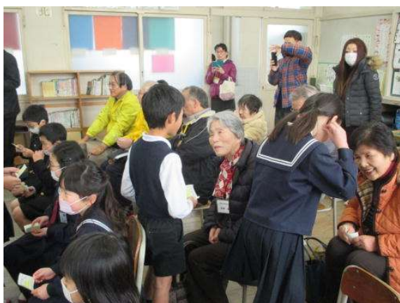
名刺を渡しました